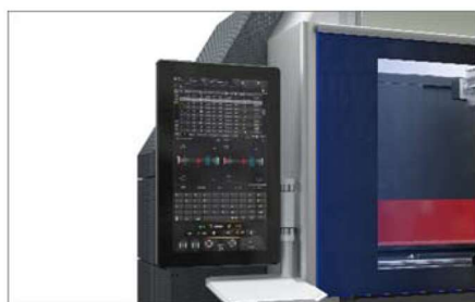
Ograniczniki pneumatyczne 05