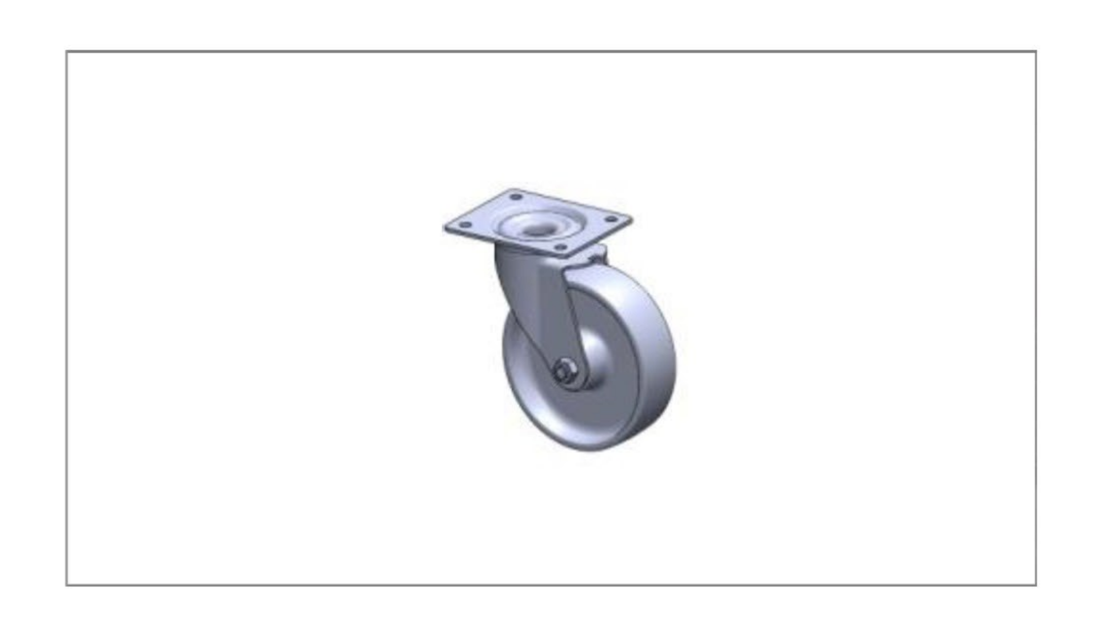
Kółka z bieżnikiem poliuretanowym (opcja)