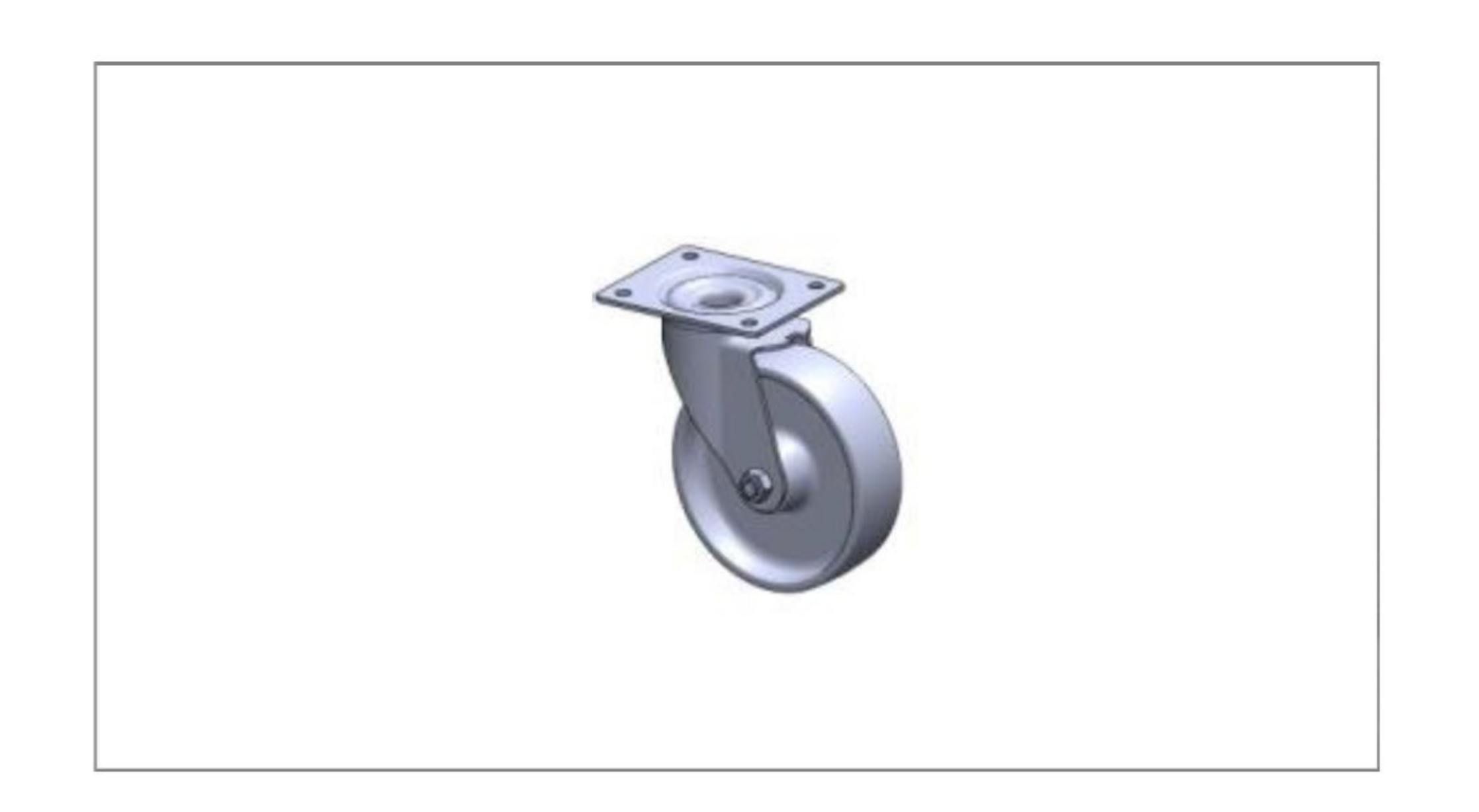
Kółka z bieżnikiem poliuretanowym (opcja)