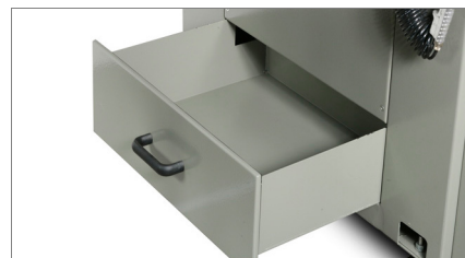
Odbiór wiórów 02