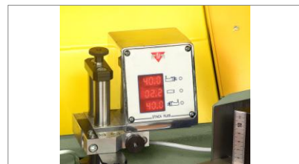
Cyfrowy wyświetlacz 02