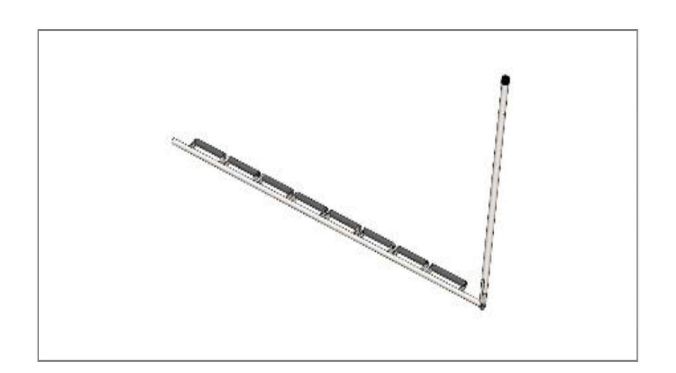
Blokada konstrukcji (opcja)