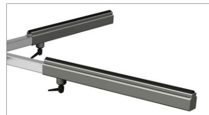
Błat pokryty przeciwślizgowym PCV 02