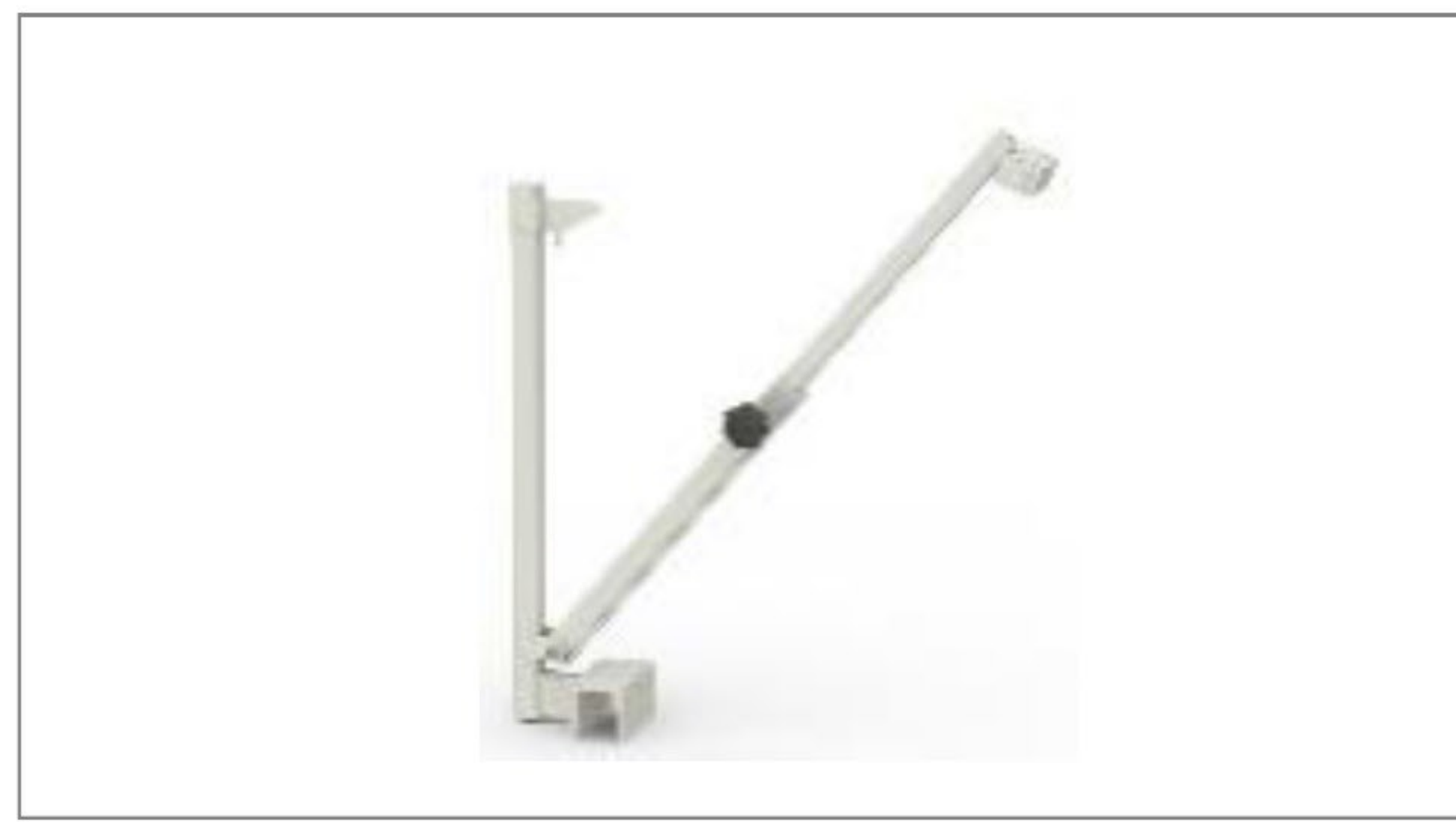
Blokada zabezpieczająca 01 tafle szkła (opcja)