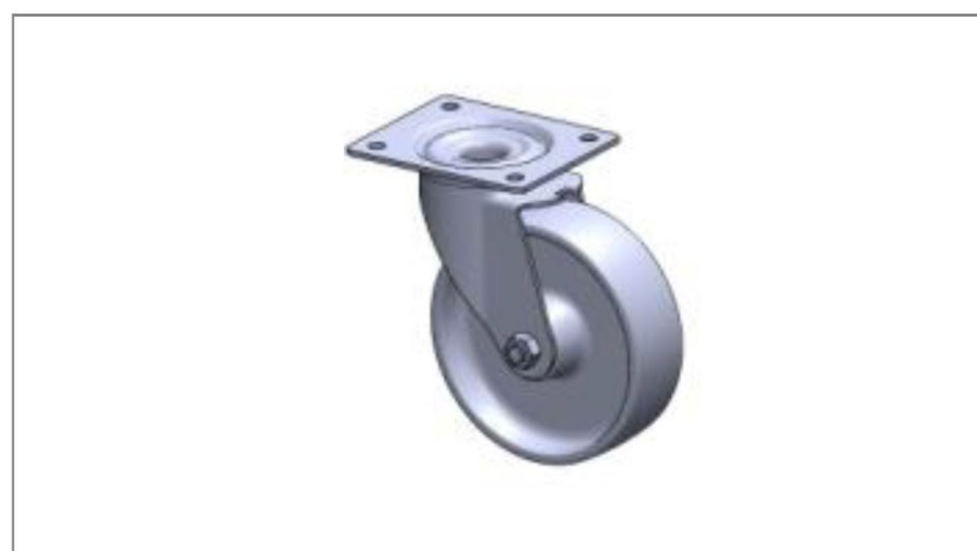
Koła z bieżnikiem poliuretanowym (opcja) 01