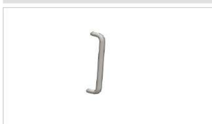
Stalowy uchwyt na dokumentację (opcja)