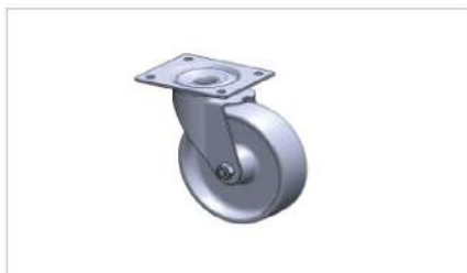
Koła z bieżnikiem poliuretanowym (opcja)