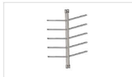
Podpora środkowa (opcja)