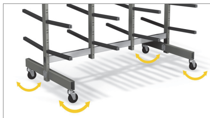
Koła skrętne 01