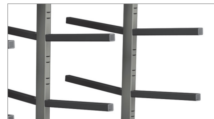
Powierzchnie styczne 02