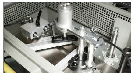
Zespół zacisków i ograniczników do obróbki kątowej 02